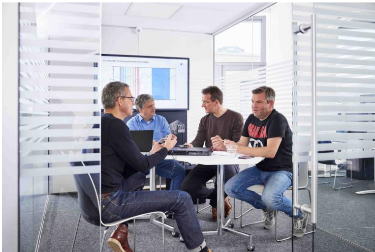
Team-Diskussion über die neuesten WMAS-Entwicklungsmuster

Wilzeck: „Ja, unsere WMAS-Lösung wird in den üblichen UHF-Frequenzbereichen für drahtlose Mikrofone koexistieren – es sind keine Änderungen der Sendeleistungsgrenzen erforderlich. Lediglich die Bandbreitenbegrenzung muss aufgehoben oder auf mindestens 6 MHz angehoben werden.“